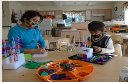
PRESENTACIÓN CONSEJO DE POLÍTICAS FEBRERO 2023